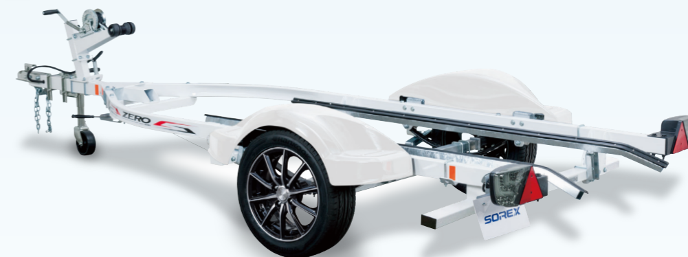
ZERO 500W （白フェンダーはオプション）