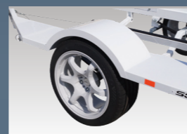
245/40 R17 タイヤを純正採用