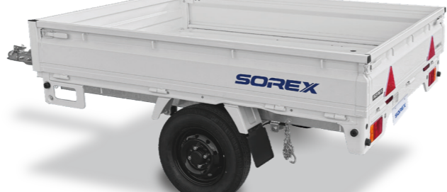
スズキキャリイベース