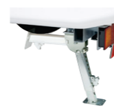
アウトリガー (標準装備)