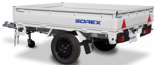
ダイハツハイゼットベース