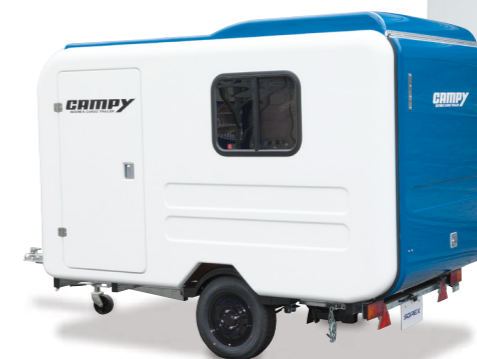
オプション (ドア・窓大/小) 装着車 (左写真)