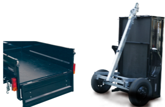
後部アオリ開放時 折りたたみ時

折りたたみサイズ： W1370×D1050 (870) ×H1965mm ※( ) 内は LF200